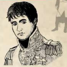
Jean-de-Dieu Soult Xeneral Maior das forzas napoleónicas en España.