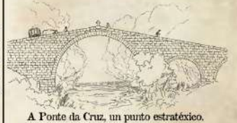
A Ponte da Cruz, un punto estratéxico.